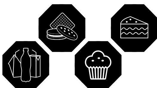
ALTOS EN AZÚCAR

Pregunta al vendedor si tiene octógonos.