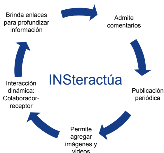
Gráfico 2. Características del blog INSteractúa

Las características del blog INSteractúa son las siguientes: