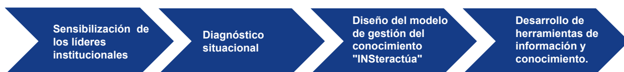
Gráfico 1. Proceso de gestión de conocimiento: pasos de la construcción del conocimiento