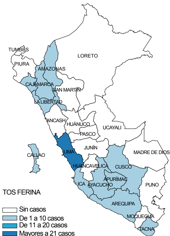
Figura 1. Tendencia semanal de muestras positivas y casos de Tos ferina, Instituto Nacional de Salud, 2017 (SE 01 - 17)