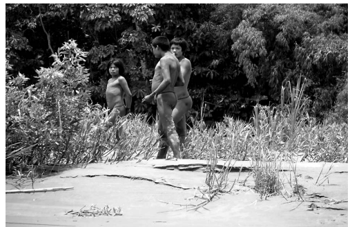
Jóvenes de la población aislada mashco piro PNM/ fotografiada en avistamiento por personal de salud de salvación - 2013