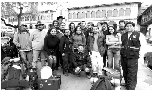
Equipo Técnico de los representantes de de los países integrantes de la OTCA