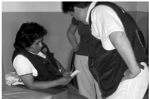
Figura 8. Deliberando sobre los resultados de la estandarización, los datos de los formatos serán posteriormente procesados en el aplicativo Excel.