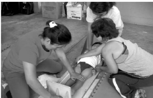
Figura 5. Realizando la lectura de la medida de longitud. Notar que se requiere de tres personas a fin de asegurar la correcta posición del niño