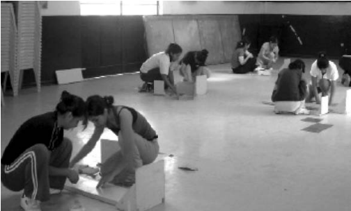
Figura 3. Antropometristas ubicando y afirmando los infantómetros al piso. Notar que el trabajo se hace en un espacio amplio donde se estandarizarán varios grupos de personas