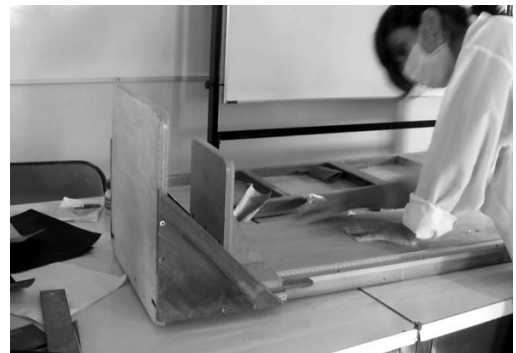
Figura 1. Mantenimiento del equipo,