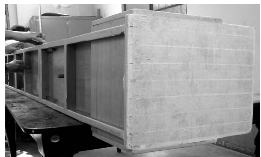
Figura 2. Se debe cubrir la parte inferior y posterior del infantómetro con cinta adhesiva masking tape con el fin de protegerlo durante el uso