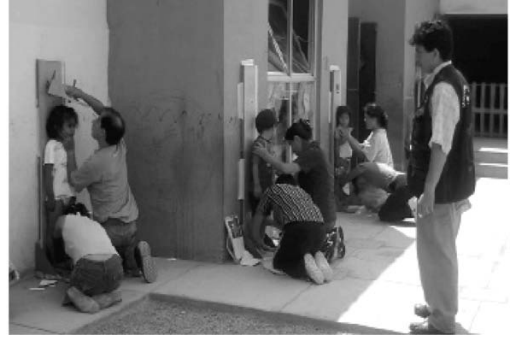
Figura 6. Proceso de estandarización en medición de estatura en ambientes externos de una institución educativa. Notar que los tallímetros han sido estabilizados afirmando los a la pared con cinta adhesiva masking tape . El supervisor observa la aplicación de la técnica del personal que se encuentra estandarizándose.