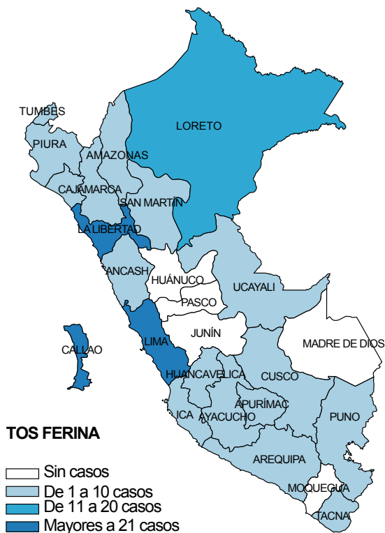
Figura 1. Tendencia semanal de muestras positivas y casos de tos ferina, Instituto Nacional de Salud, 2018 (SE 01-17)